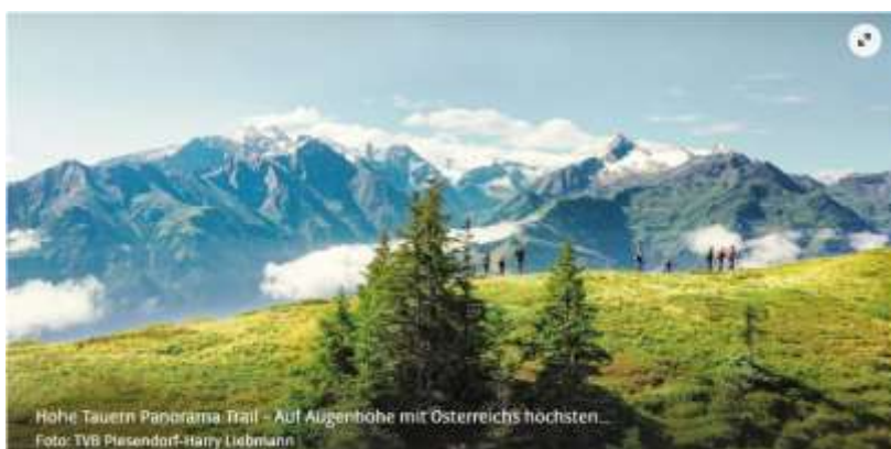
Hohe Tauern Panorama Trail – Auf Augenhöhe mit Österreichs höchsten...