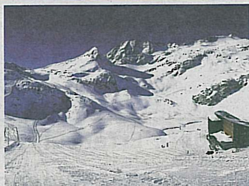
Vollendeter kann Skispaß nicht sein: Von der Türe geht es direkt in die Gletscherwelt Weißsee.

Wir verlosen im Gewinnspiel mit unserem Partner, dem Berghotel Rudolfshütte in der Weißsee Gletscherwelt, einen Toppreis für Skifahrer und Naturliebhaber: Fünf Nächte für zwei Personen im Doppelzimmer inklusive Halbpension, Leihski und Skipässen. Teilnehmer beantworten bitte die folgende Frage: „Worauf freuen Sie sich im Frühling besonders?“ Die Antwort schreiben Sie bitte mit dem Stichwort „mehr-Gewinnspiel“ und Angabe der Telefonnummer an: Abendzeitung, Redaktion „mehr Freude am Leben“, 80265 München oder eine Email an: redaktion-mehr@abendzeitung.de. Einsendeschluss ist Montag, der 31. Januar 2011.